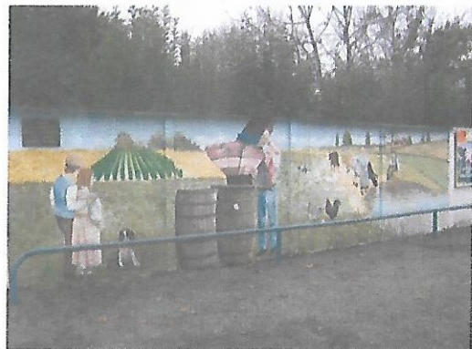
Bercloux, Fresque «Fin de la guerre en A.F.N. Algérie-Maroc-Tunisie»