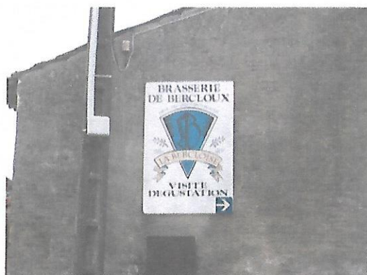
La Brasserie de Bercloux "La Berchoise"