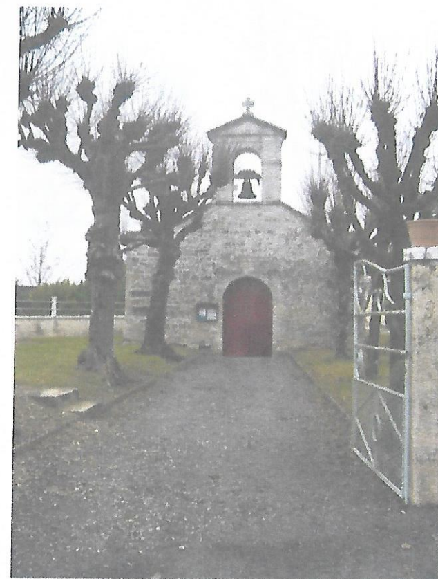
L'église de Bercloux