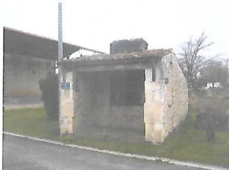
LeFour de chez Couprie